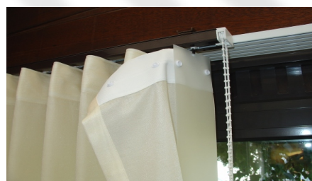
Für alle Lamellen wiederholen