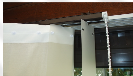
Erst von der linken Seite den Stoff fixieren